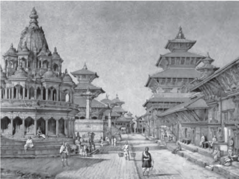
तस्बिर २: गुस्ताभ ले बोनले सन् १८८५ मा खिचेको फोटोलाई लिथोग्राफ गरिएको हो । गोर्ज ह्याडमुलरको 'पाटन म्युजियम' पुस्तकको पृ. २२ बाट लिइएको हो ।