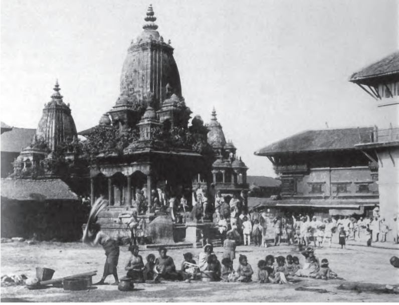
तस्बिर १: कर्ट बेयकले सन् १८९९ मा खिचेको फोटो गोर्ज ह्याडमुलरको पुस्तक 'पाटन म्युजियम' पुस्तकको पृ. ३२ बाट लिइएको हो ।